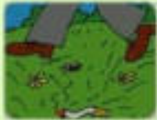
БРОШЕННАЯ СПИЧКА (ОКУРОК)