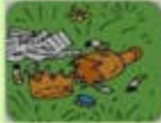
ОСКОЛКИ СТЕКЛА И МУСОР

За нарушение правил пожарной безопасности в лесах предусмотрен АДМИНИСТРАТИВНЫЙ ШТРАФ или УГОЛОВНАЯ ОТВЕТСТВЕННОСТЬ